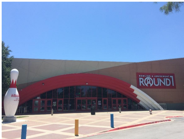
ラウンドワン グレイブバインミルズ店 米国テキサス州ダラス 2016年5月20日 オープン！