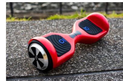
『バランススクーター』