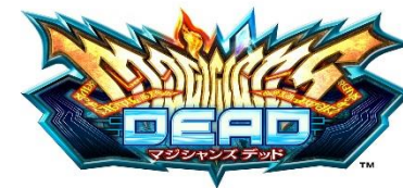
『マジシャンズデッド』