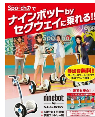
『ninebot by SEGWAY』