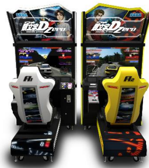
『頭文字D Zero』 (c)しげの秀一/講談社・ 2014新劇場版「頭文字D」製作委員会 (c)