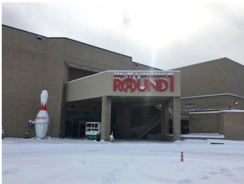
ラウンドワンエクストン店 米国ペンシルベニア州エクストン 2016年12月9日オープン！