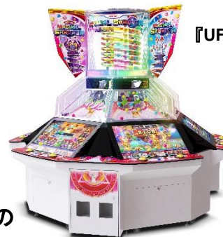
『マジカルシューター』