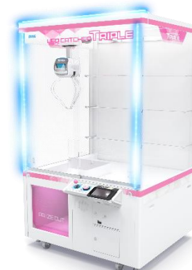
『UFOキャッチャートリプル』