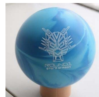
『キッズ用マイボール』