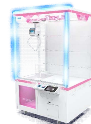
『UFOキャッチャートリプル』