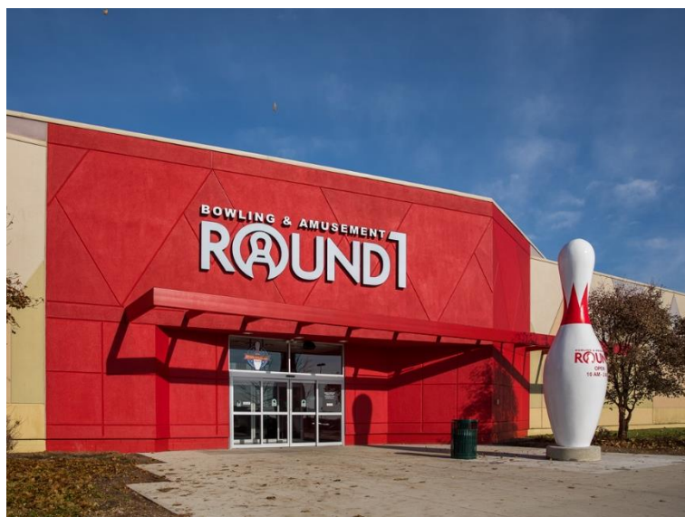
ラウンドワン グレイトレイクスクロッシング店 米国ミシガン州 2017年10月21日オープン！