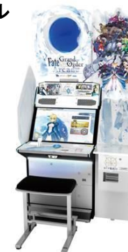
『Fate/Grand Order Arcade』 ©SEGA