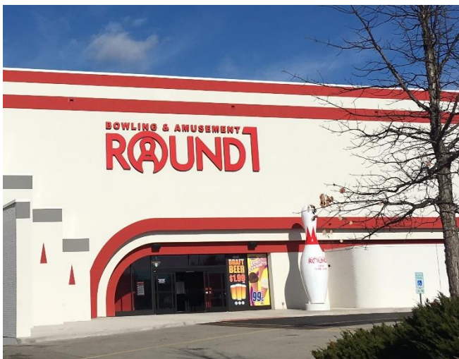
ラウンドワンノースウッド店 米国 イリノイ州 2017年11月18日オープン！