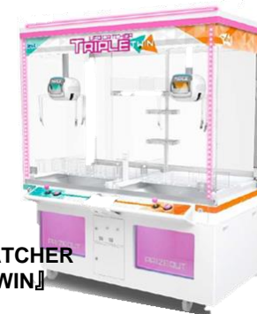
『UFO CATCHER TRIPLE TWIN』 ©SEGA