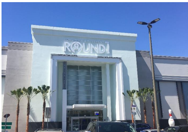
ラウンドワン テメキュラプロムナード店 米国 カリフォルニア州テメキュラ 2019年3月30日オープン！