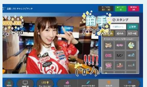
プロスタンプ、メッセージの送信

『全国LIVEチャレンジマッチ』機能にて、全国のラウンドワンから人気女子プロボウラーにリアルタイムで挑戦できるプロチャレ企画が8月より随時開始。