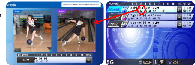
ボウリングフォームチェッカーイメージ

・『ROUND1 LIVE』導入により、前方、後方からの投球の様子が撮影可能となり、3月より、スコアモニターにて各フレームをタッチすると、そのフレームの投球をリプレイする機能を搭載。