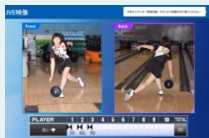
投球フォーム専用画面