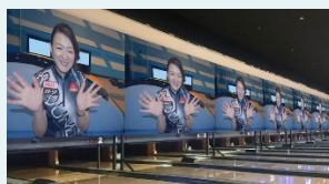
LEDウォールビジョン