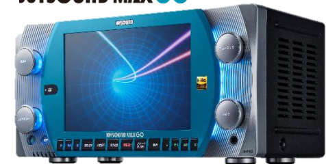
『JOYSOUND MAX GO』©エクシング