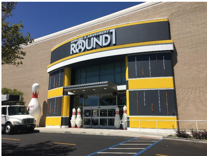
ラウンドワン メドーウッド店 米国 ネバダ州リノ 2019年8月17日オープン！