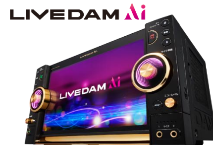
『LIVEDAM Ai』© 第一興商

・既存のスタンダード店舗へスポッチャを併設し、12月に一斉オープン予定。 (対象店舗 : 武蔵村山店 / 習志野店 / 松山店 / 津高茶屋店)