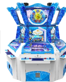
『海物語ラッキーマリントアーズ』